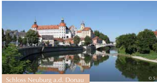
Schloss Neuburg a.d. Donau