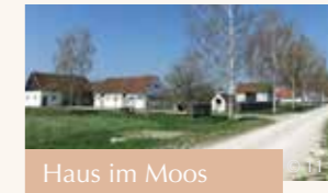
Haus im Moos Umweltstation und Freilichtmuseum

... lassen Sie sich zu einem Aufenthalt in unserer Region inspirieren: