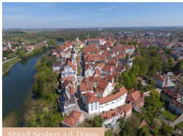
Altstadt Neuburg a.d. Donau

Gemütliche Straßencafés, sowie heimische bayerische, aber auch internationale Küche laden zu Pause und Stärkung ein.