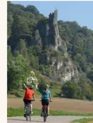
Urdonautal, Amper- Altstuhl-Radweg