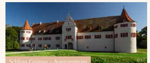
Schloss Grünau – Auenzentrum