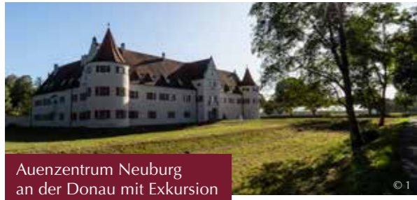
Auenzentrum Neuburg an der Donau mit Exkursion