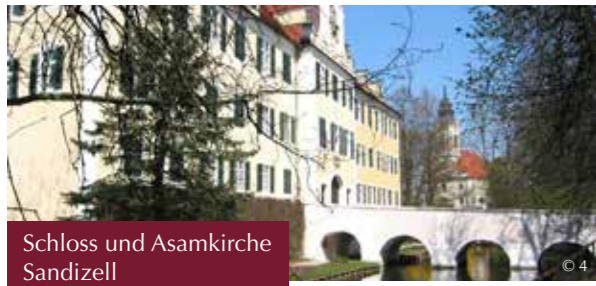
Schloss und Asamkirche Sandizell