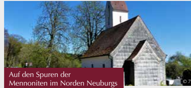
Auf den Spuren der Mennoniten im Norden Neuburgs

(von April bis Oktober) Dauer: 1 – 3 Stunden