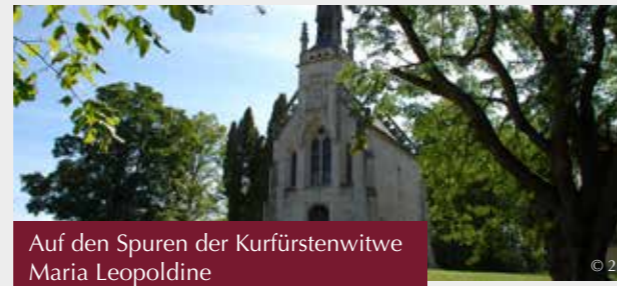
Auf den Spuren der Kurfürstenwitwe Maria Leopoldine