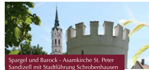
Spargel und Barock - Asamkirche St. Peter Sandizell mit Stadtführung Schrobenhausen