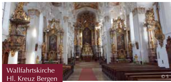
Wallfahrtskirche Hl. Kreuz Bergen

Entdecken Sie mit uns Gartenanlagen im Landkreis Neuburg-Schrobenhausen