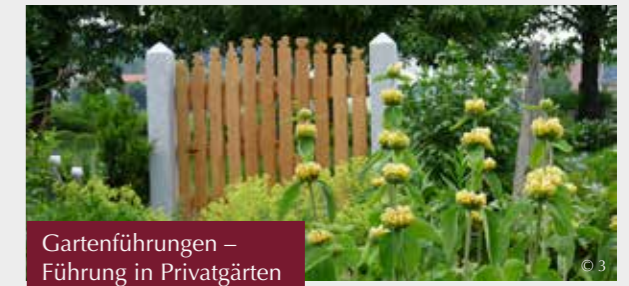
Gartenführungen – Führung in Privatgärten