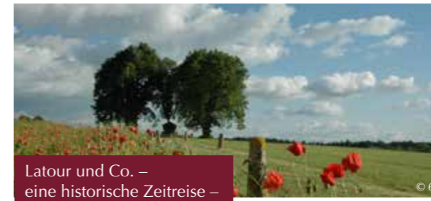
Latour und Co. – eine historische Zeitreise –