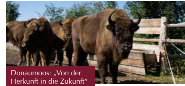
Donaumöos: „Von der Herkunft in die Zukunft“