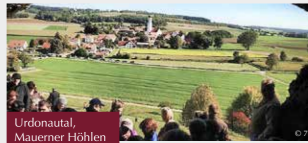
Urdonautal, Mauerner Höhlen